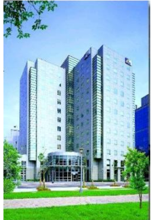
台北臺聚總部大樓